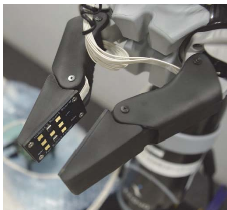
図1 ロボットアームに取り付けたバスネットワーク型集積化フィンガーセンサー

MEMS (micro electro mechanical systems) は人間と機械との間をつなぐ入出力システムとして広く利用されていますが、それを発展させた新しいマイクロシステムを創出しています。たとえば、情報通信や無線センサの要となる周波数選択・制御デバイス、人間と共生する次世代ロボット用触覚センサ、高性能ジャイロスコープ、安心・安全、健康、あるいは省エネルギーのための各種センサなどがあります。これらのマイクロシステムは、これまでにない機能や性能を発揮するために、集積回路との一体化、機能性材料の利用、新しいパッケージングなどを必要とします。そのため、異種要素をウエハレベルで集積化するヘテロ集積化技術、ウエハレベル・パッケージング技術、機能性材料の成膜技術などの基盤技術も開発しています。また、企業との共同研究、技術支援、研究機器の公開、および国際連携にも力を入れています。