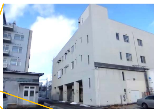
マイクロ・ナノマシニング 研究教育センター（MNC）