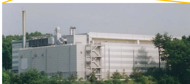
西澤潤一記念研究センター